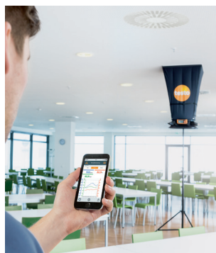
Мобильное приложение, подключаемое по Bluetooth, позволяет отображать данные измерений на экране мобильного устройства и создавать протоколы измерения прямо на месте замера.