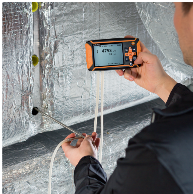
Съемная конструкция измерительного прибора позволяет проводить измерения в воздуховодах с помощью трубки Пито (трубка Пито доступна в качестве дополнительной принадлежности).