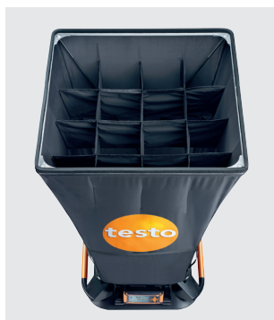
Выпрямитель потока для гораздо более точных измерений на вихревых диффузорах