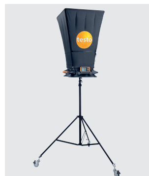
Устойчивый штатив на колесиках с креплением в центре для надежной работы устройства на вихревых диффузорах, установленных на высоте.