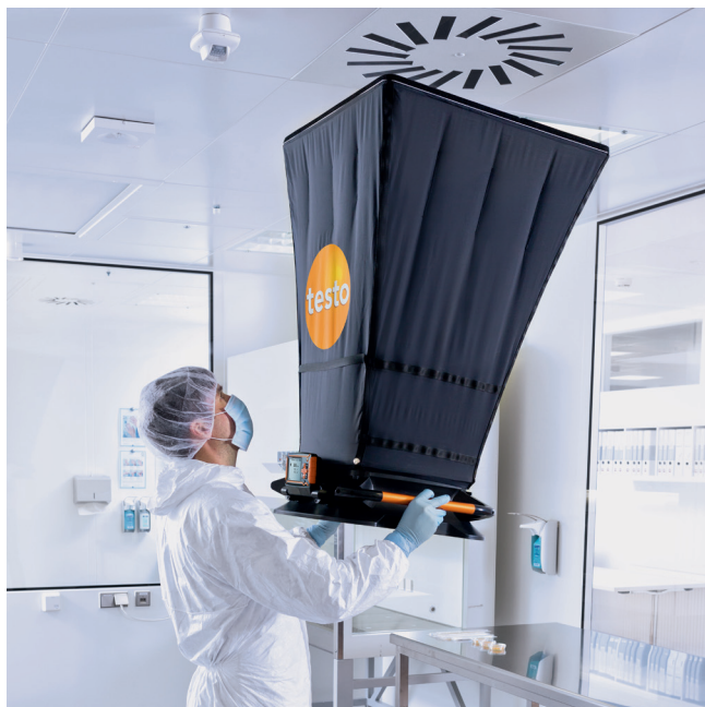
Удобство измерения благодаря небольшому весу прибора.